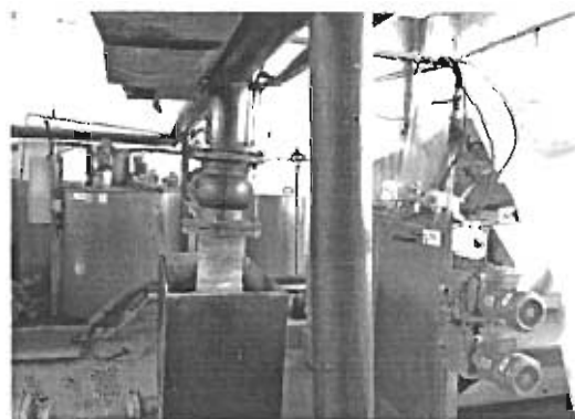
Неиспользуемый пресс-фильтр в здании очистных сооружений г. Зеленодольск

В 2015 году исполкомом и Советом района в МУП «Городское зеленое хозяйство г. Зеленодольска» были переданы шесть бывших в употреблении легковых автомобилей (Audi Q7, BMW X5, Range Rover Sport, Nissan Teana, Kia Spektra, Шевроле Нива), которые далее были реализованы через аукцион, а средства от продажи были использованы на текущие расходы муниципального учреждения. В результате указанной операции районным бюджетом было недополучено 2,0 млн. рублей.