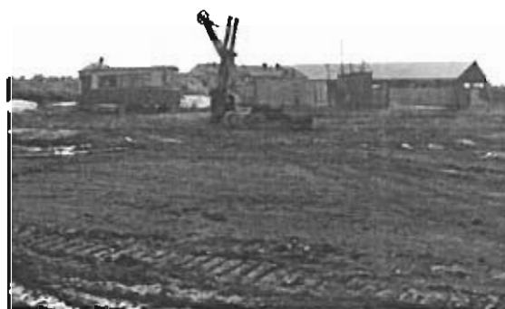
Несанкционированный карьер по добыче нерудных материалов

По итогам проверки в Камско-Устьинском муниципальном районе выявлены отдельные нарушения и недостатки в сфере управления и распоряжения муниципальной собственностью. В установленном порядке не переданы эксплуатирующим организациям объекты коммунальной инфраструктуры общей балансовой стоимостью 49,6 млн. рублей. Установлено завышение стоимости выполненных работ на общую сумму 1,8 млн. рублей, а также отдельные нарушения порядка ведения бухгалтерского учета и составления отчетности.