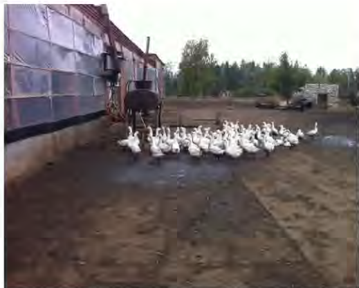
Комплекс нежилых зданий по адресу: г. Бугульма, ул. Гончарова 18,

распоряжением Главы Бугульминского муниципального района в 2010 году переведены в использование под «карьер» (собственник участков – ООО «Терра», г. Москва).