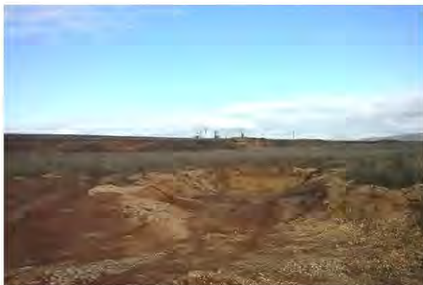
Котлован под полигон ТБО в п. Карабаш