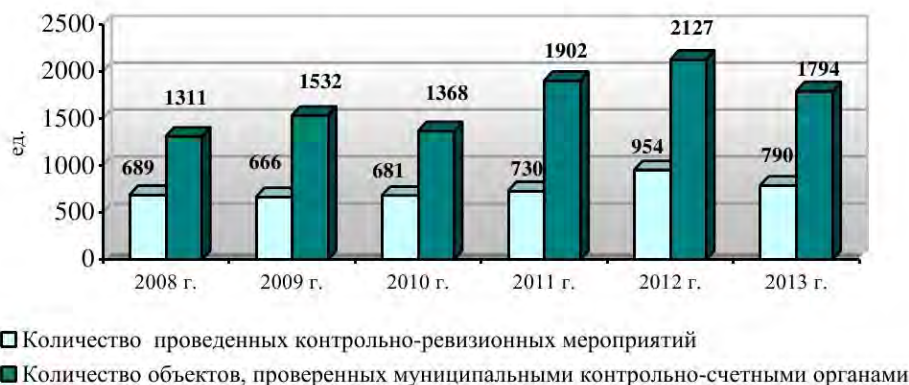
Динамика контрольно-ревизионных мероприятий, проведенных муниципальными контрольно-счетными органами

По итогам проверок принято мер и восстановлено средств в бюджеты муниципальных образований на сумму 1975 млн. рублей.