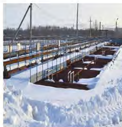
Реконструкция очистных сооружений с сетями в г. Азнакаево