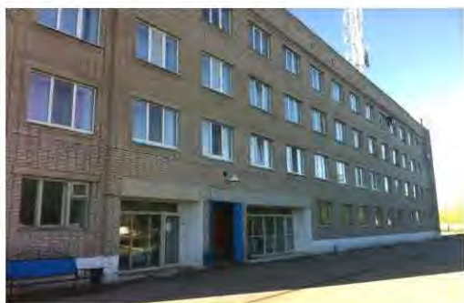
Здание бывшей гостиницы на территории аэропорта «Бугульма»

Плата за пользование указанным имуществом за проверяемый период в