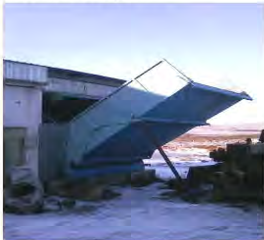
Мусоросортировочная линия на полигоне ТБО в пгт Камское Устье

нежилые помещения, мусоросортировочная линия) на общую сумму 24 417,5 тыс. рублей.