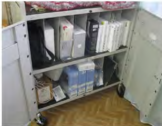
В Бугульминской школе-интернате с 2005 года не используется компьютерное оборудование на сумму 0,5 млн. рублей

Выявлены факты неэффективного использования государственного имущества (компьютерной техники, иного инвентаря) на общую сумму 2,3 млн. рублей.