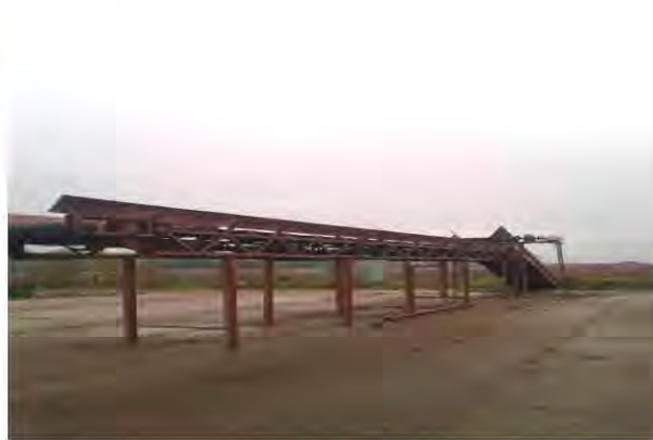
Мусоросортировочная линия полигона ТБО в г. Бугульма

По итогам проверки в адрес Главы Бугульминского муниципального района направлено представление об устранении выявленных нарушений.