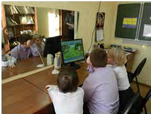
В школе-интернате № 7 г. Казани не оприходовано компьютерное оборудование, иные материальные ценности на общую сумму 3,3 млн. рублей

Неэффективное использование бюджетных средств, обусловленное сверхнормативным расходом энергетических ресурсов, составило 15,8 млн. рублей.