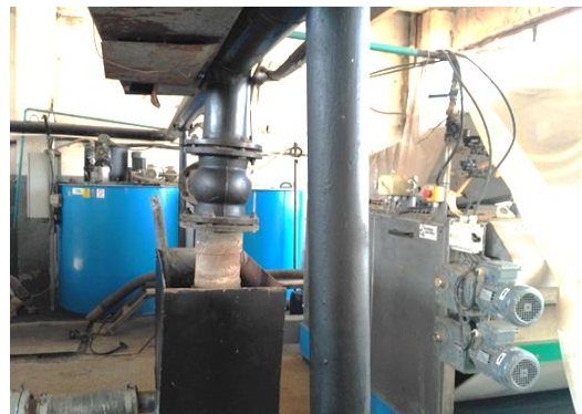
Неиспользуемый пресс-фильтр в здании очистных сооружений г. Зеленодольск

В 2015 году исполкомом и Советом района в МУП «Городское зеленое хозяйство г. Зеленодольска» были переданы шесть бывших в употреблении легковых автомобилей (Audi Q7, BMW X5, Range Rover Sport, Nissan Teana, Kia Spektra, Шевроле Нива), которые далее были реализованы через аукцион, а средства от продажи были использованы на текущие расходы муниципального учреждения. В результате указанной операции районным бюджетом было недополучено 2,0 млн. рублей.