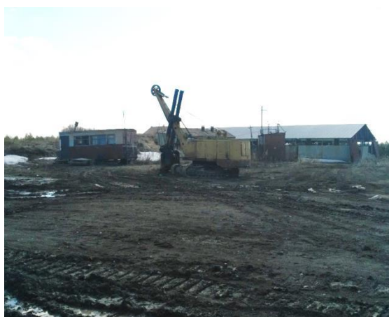
Несанкционированный карьер по добыче нерудных материалов

По итогам проверки в Камско-Устьинском муниципальном районе выявлены отдельные нарушения и недостатки в сфере управления и распоряжения муниципальной собственностью. В установленном порядке не переданы эксплуатирующим организациям объекты коммунальной инфраструктуры общей балансовой стоимостью 49,6 млн. рублей. Установлено завышение стоимости выполненных работ на общую сумму 1,8 млн. рублей, а также отдельные нарушения порядка ведения бухгалтерского учета и составления отчетности.