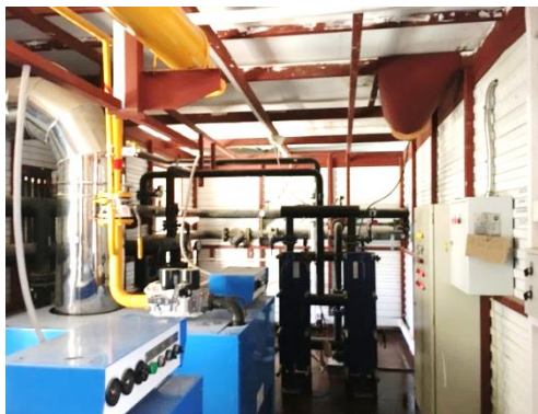
Оборудование блочно-модульной котельной в Свяжском сельском поселении

приобретения в 2012 году не эксплуатировалось оборудование блочно-модульной котельной стоимостью 2,3 млн. рублей в Свяжском сельском поселении.