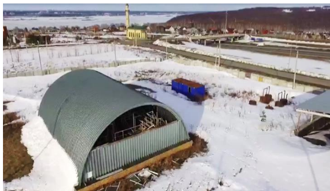
Биологические очистные сооружения мощностью 1000 м 3 /сутки коттеджного комплекса «Пятидворье» Верхнеуслонского муниципального района

эксплуатирующим организациям. Так, не обеспечен ввод в эксплуатацию и сохранность объекта «Биологические очистные сооружения мощностью 1000 м 3 /сутки коттеджного комплекса «Пятидворье» Верхнеуслонского муниципального района» стоимостью 70,8 млн. рублей.